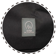
ETIQUETA MARCA PU