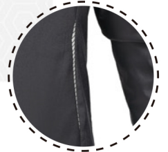
REFLECTANTES EN ESPALDA

Nuestra PARKA RALCO con excepcional capacidad de abrigo sin ser pesado ni voluminosa. Con buen nivel de repelencia y transpirabilidad.