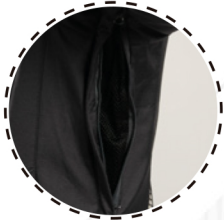
VENTILACIÓN CON CIERRE Y MESH